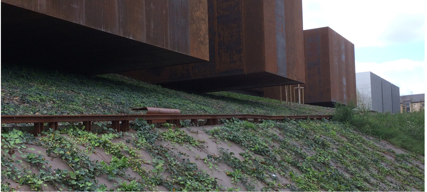
Het park rondom het Museum Pierre Soulages

Op 31 mei 2014 opende het Musée Pierre Soulages zijn deuren, op initiatief van de communauté d'agglomération van Grand Rodez (een samenwerkingsverband van gemeenten). Het museum werd gebouwd om het werk van de beroemde schilder te exposeren, maar zal ook tal van tijdelijke tentoonstellingen brengen die andere hedendaagse kunstenaars in de schijnwerpers plaatsen.